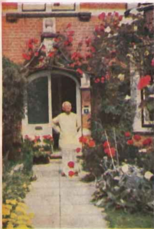
স্বচ্ছন্দে শিখর বাঁধির বাগানে