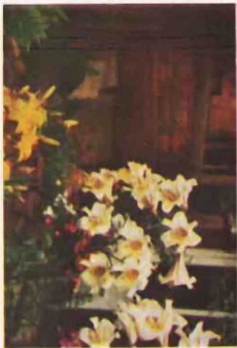
Spencer's eyes in 1917