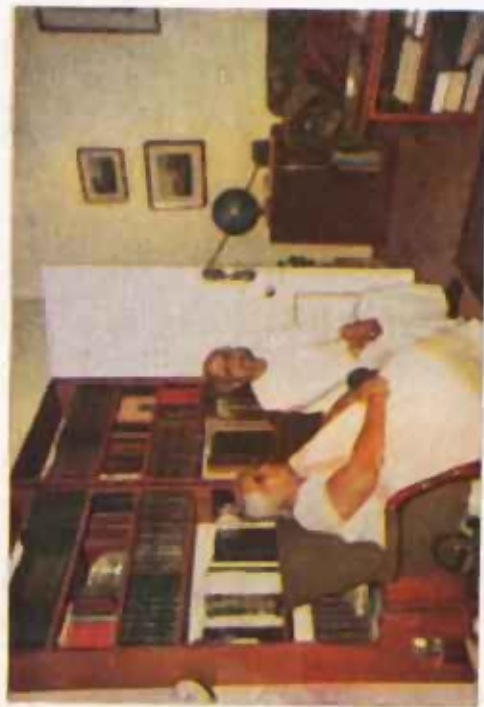
संस्कृत विभागाच्या कार्यशाळात सहभागी